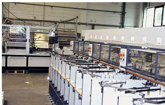
Die Renz-Drahtkamm-Bindemaschine wird inline mit der Theisen & Bonitz tb flex B117 HP betrieben und ermöglicht so eine vollautomatische Kalenderproduktion.