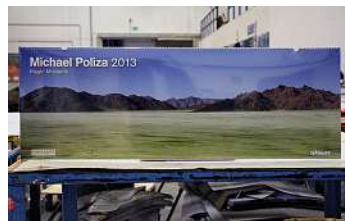
Überbreite Kalender mit Panoramaaufnahmen liegen auch im Trend.

In einem Hochregallager mit 550 Stellplätzen bietet IHS Dortmund Einlagerungen aller Art an, ausgenommen Gefahrgüter.